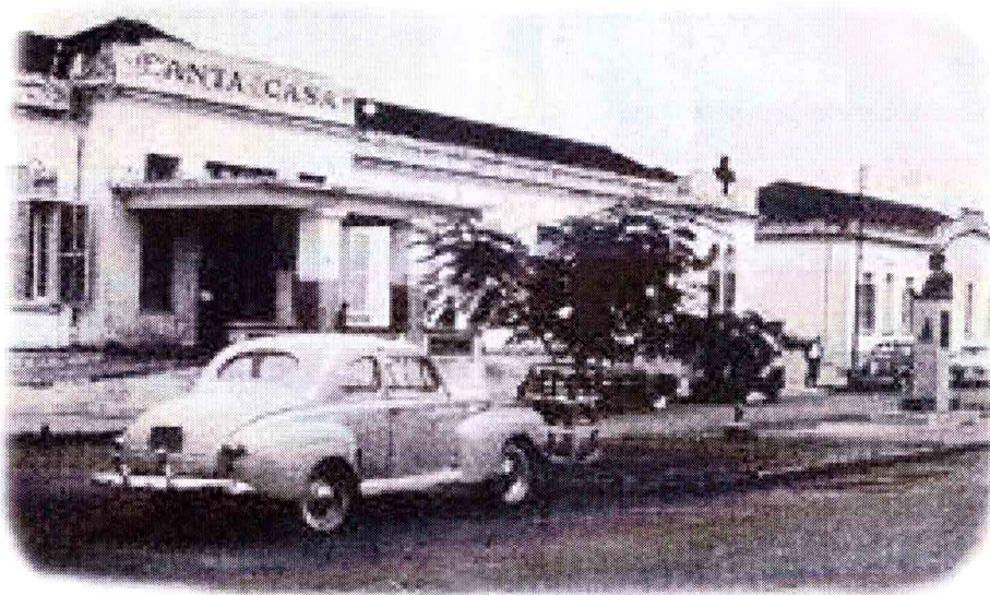
Foto da Irmandade da Santa Casa de Misericórdia de São Carlos, década de 50